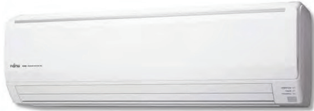
ASY 50 Ui-LF