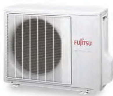
ASY 50 Ui-LF