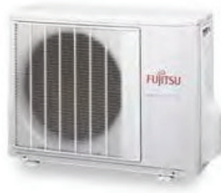
AGY 40 Ui-LV