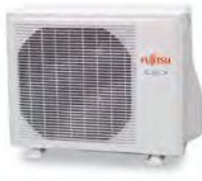
AGY 25-35 Ui-LV