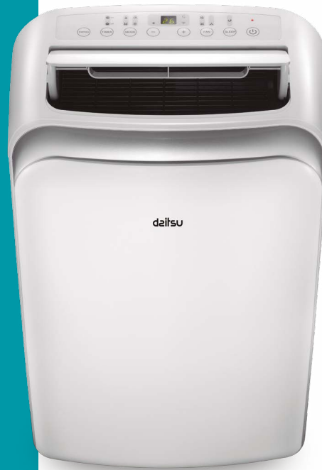
APD 9-12 CRV2 - APD 12-HRV2